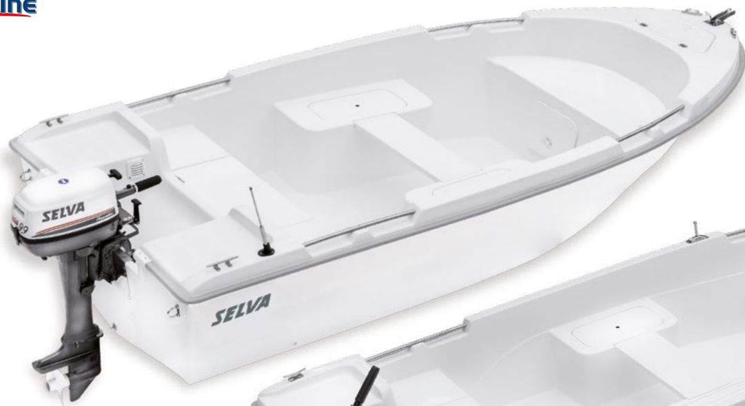
Modello Tiller Line T.4.0