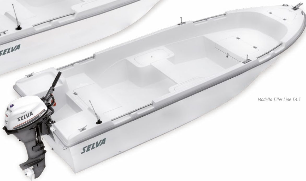
Modello Tiller Line T.4.5