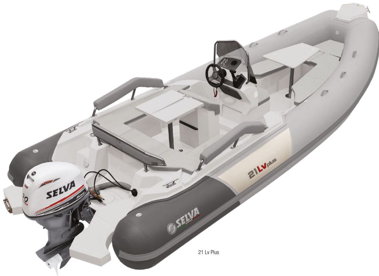
21 Lv Plus