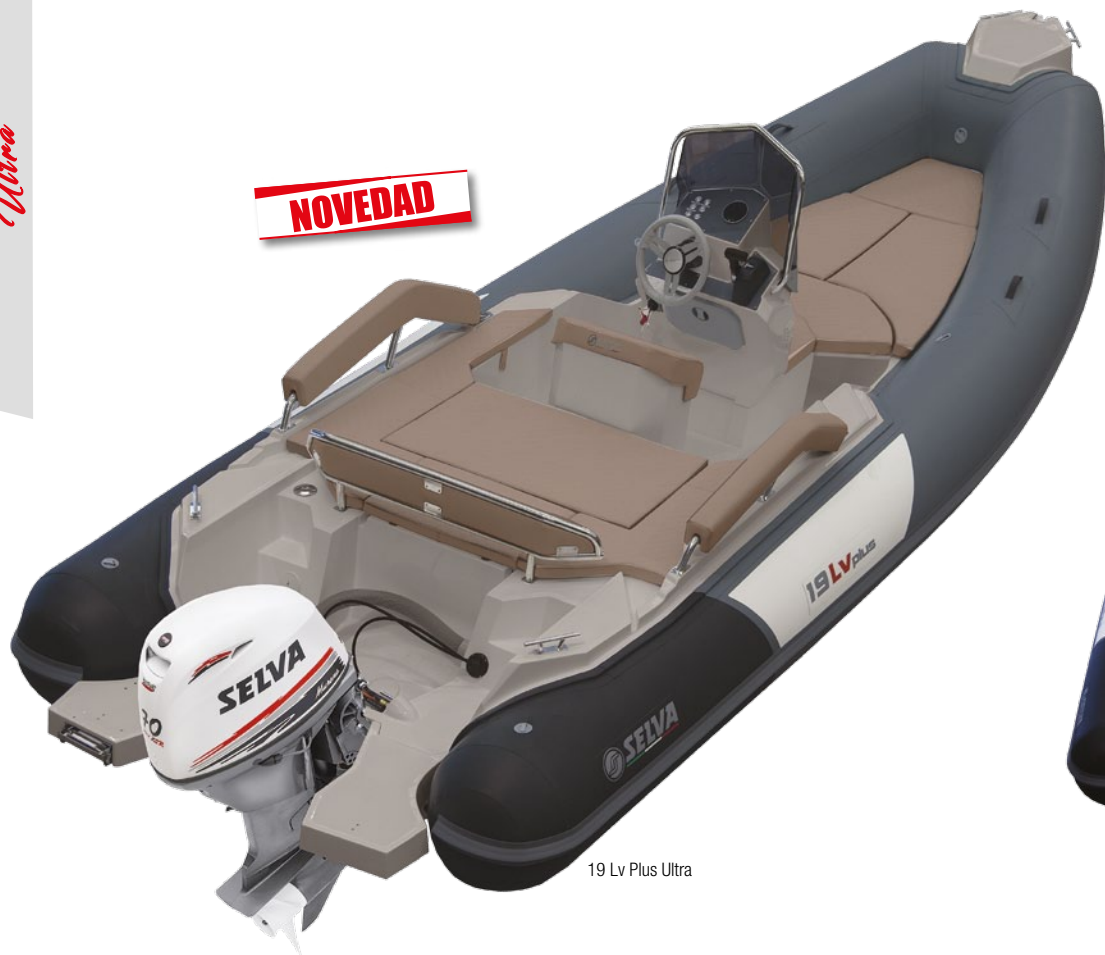
19 Lv Plus Ultra