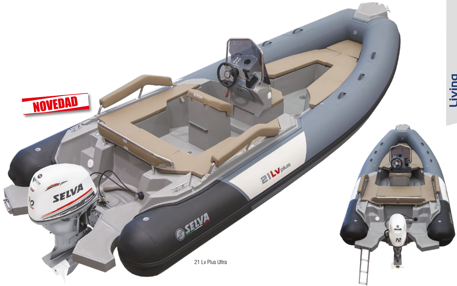
21 Lv Plus Ultra