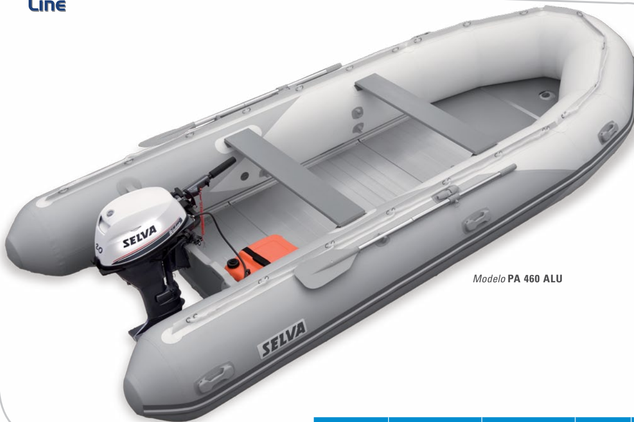
Modelo PA 460 ALU