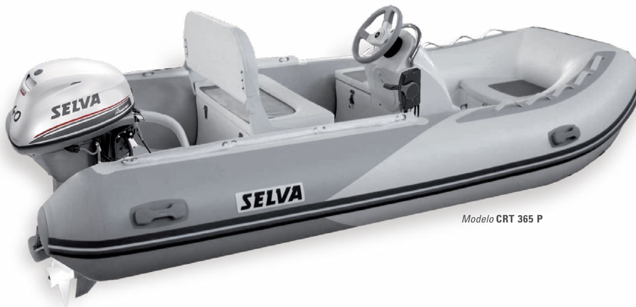
Modelo CRT 365 P