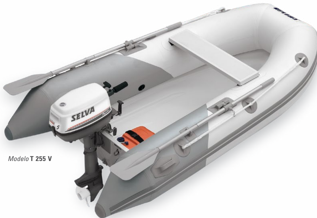
Modelo T 255 V