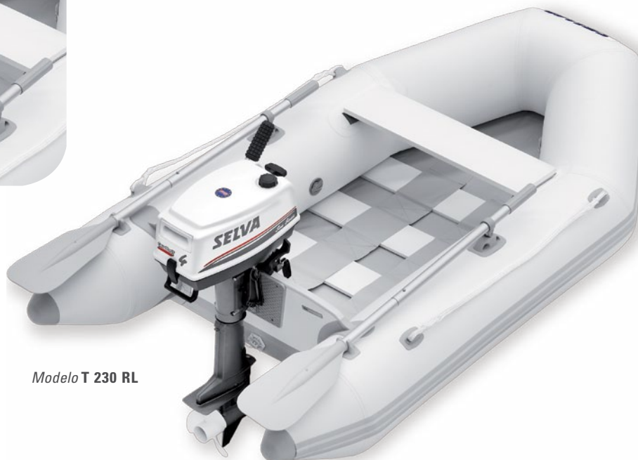
Modelo T 230 RL