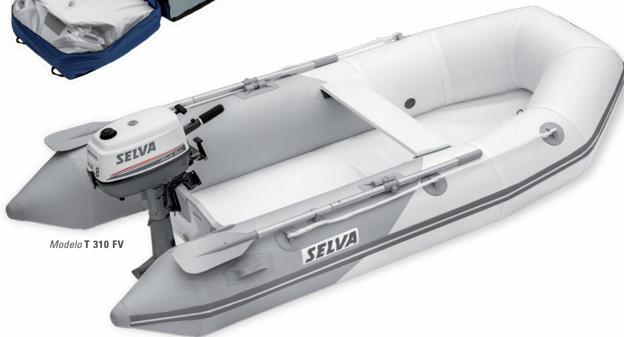
Modelo T 310 FV