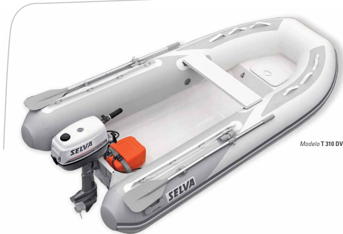
Modelo T 310 DV