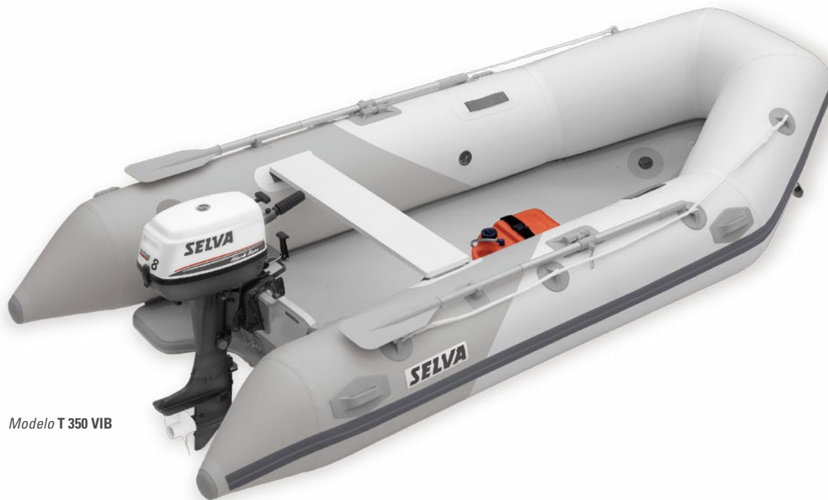
Modelo T 350 VIB