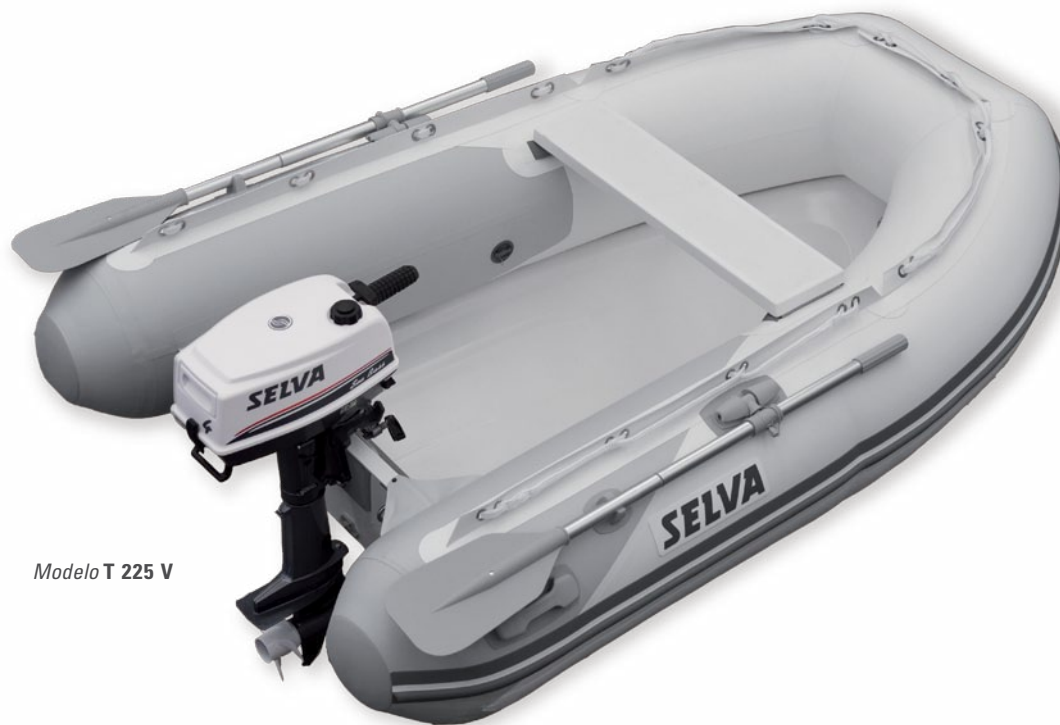
Modelo T 225 V